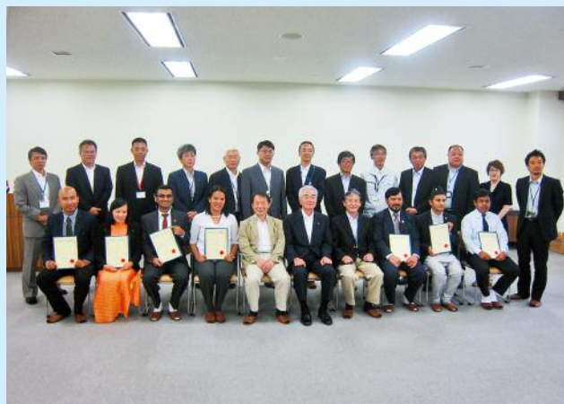
研修終了式後の記念写真