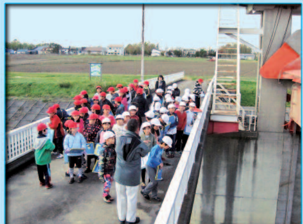
岩見沢東小学校 4 年生 58 名 H28.10.14