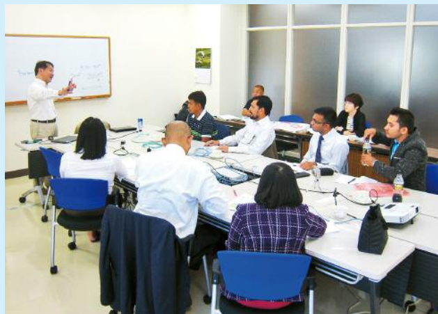
用水管理に係る問題分析の様子