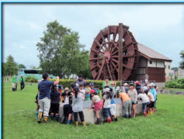
砂川小学校 3 年生 40 名 H28.7.19