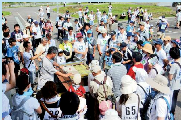
光珠内調整池周りを歩く参加者