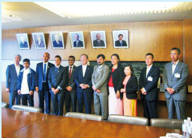
岩見沢市への表敬訪問

7名の研修生はそれぞれ自国で農業用水路を管理する公的機関に勤められている方々で、今回の研修では日本の土地改良区で行われている農民主体型用水維持管理システムを学びました。1ヵ月半におよぶ長期研修で研修生達が学んだ知識や技術を自国の農業用水管理の発展に資する事を願っています。最後に今回の研修生受入にご協力いただいた関係機関の皆様にお礼を申し上げます。